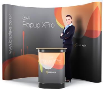
پاپ آپ نمایشگاهی