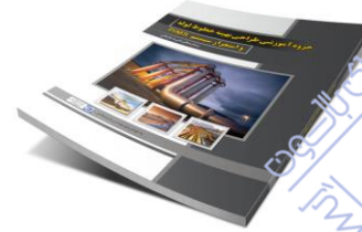
فایل های مرتبط