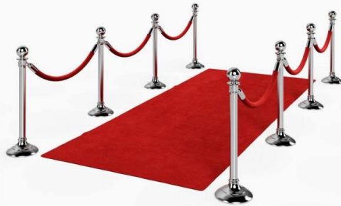
فرش قرمز و استند جداکننده